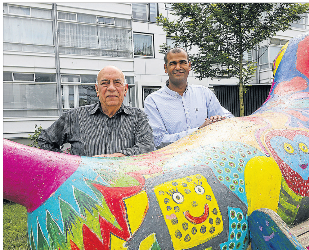
Kokkedal er det første sted i Danmark, der har afprøvet og udviklet Baba - Fædre for Forandring. Efter sommerferien skal projektet udbredes til Nørrebro, Høje Taastrup og Tingbjerg, og på sigt hele landet.

er, børns behov, opdragelse eller lignende.